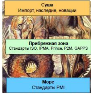
William Blake: Behemoth and Leviathan